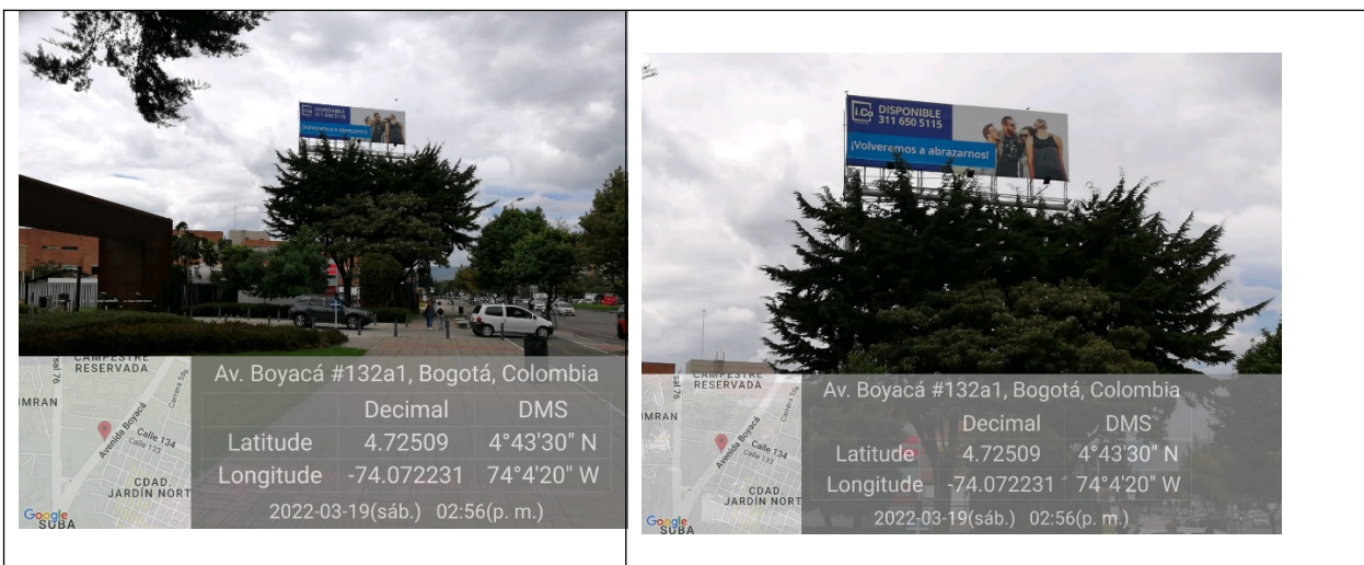
Foto 1. Vista panorámica del predio y de la valla ubicada en la Av. Carrera 72 No. 132 A 27 (dirección catastral) Orientación Sur-Norte